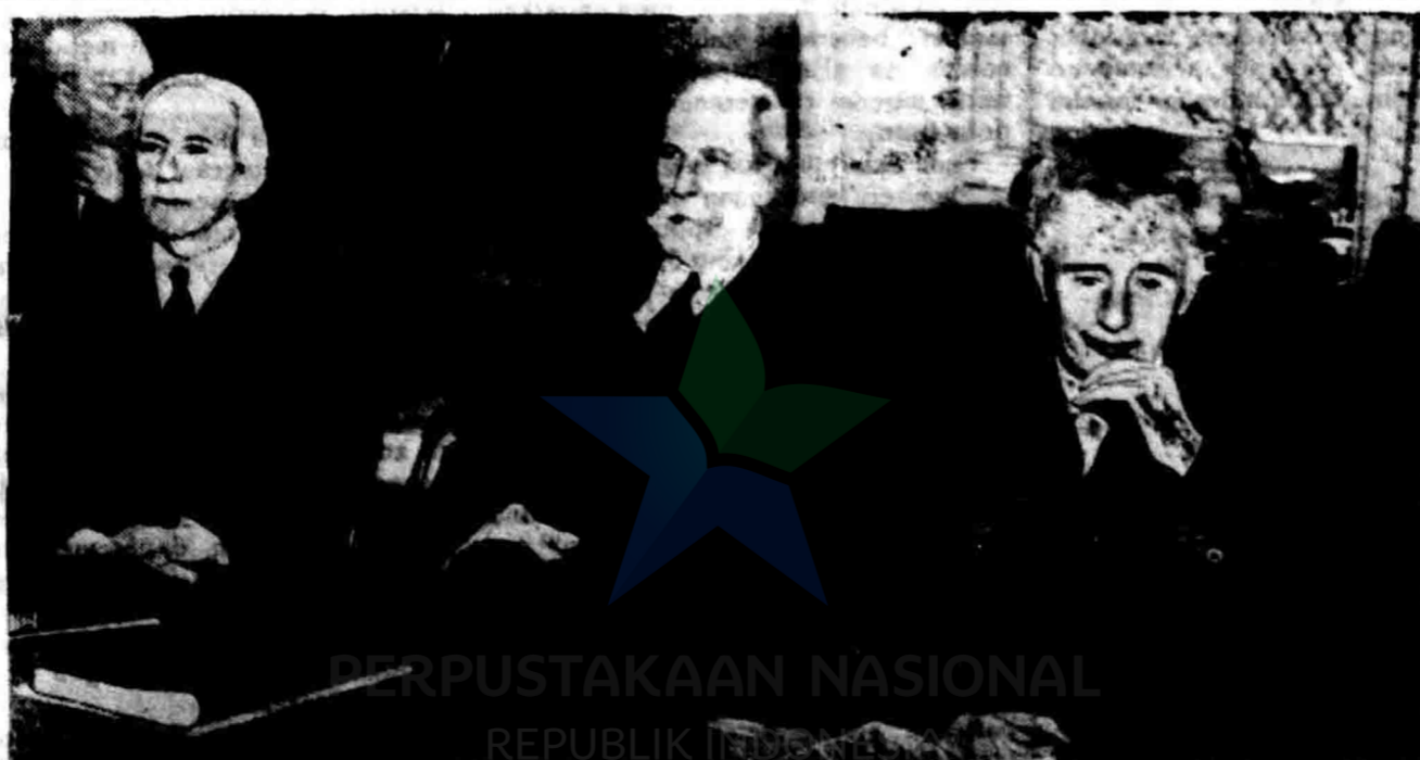
Mahkamah Tinggi di Amerika sedang membitjarakan hak pengakoean perwakilan kaum boeroeh dengan mendjikan jang kemoesn diterima baik. Ditegah-tengah jalah ketoea Mahkamat Ch. E. Hughes, dikirinja Willis van Levanter, dan Louis Brandeis.