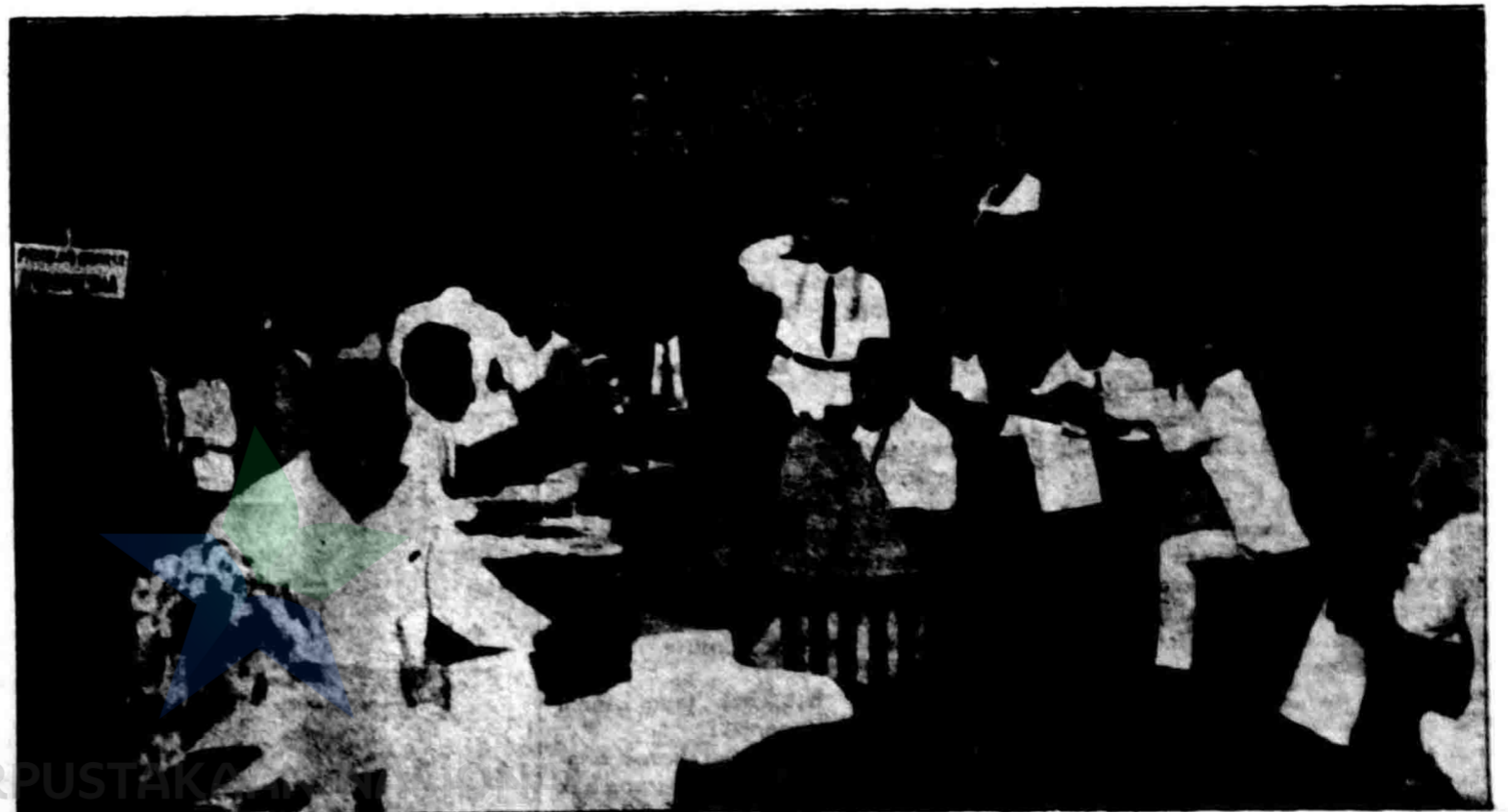
PERPUSTAKAAN REPUBLIK INDONESIA

Congres P. B. I. - almarhoem jang pertama diadakan di paviljoen G. N. I. Soerabaja.